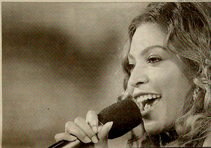
Beyoncé Knowles no descarta grabar un disco íntegro en español

Beyoncé, quien no habla español pero ha trabajado fonéticamente las letras de los temas que interpreta en este disco, también destaca su debilidad por la colombiana Shakira, con quien grabó este año el tema 'Beautiful liar', que también incluirá la re-