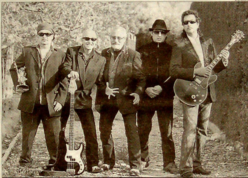
Los Bluesfalos están a punto de cumplir los 20 años encima de un escenario

Todo empezó con Barracudas. Sí, en los primeros 70's. Veíamos una orquesta tocando, y con tal de tocar un par de rocanroles nos aguantábamos toda una noche de pasodobles y rumbas para que nos dejaran tocar una canción. En esos tiempos no había escena ni nada. Más adelante fundamos Fe-